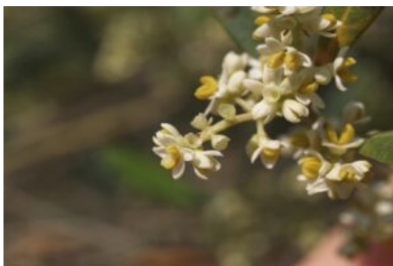
Fleurs mâles et fleurs hermaphrodites