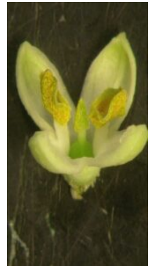
Fleur vue en coupe (2 pétales enlevés)

La fleur de l'olivier est petite, elle mesure de 3 à 6 mm. La phyllotaxie d'ordre 2 joue. Elle a :