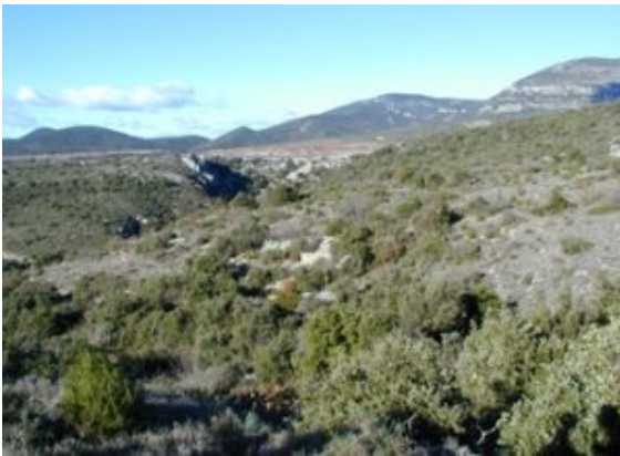
Oliveraie médiévale Montpeyroux

Même si l'oléiculture française est insuffisante, de loin, aux besoins des consommateurs français, néanmoins, elle fait vivre des oléiculteurs dont la majorité vise des produits d'excellence, des produits de haute qualité : huile, fruits de bouche, tapenades et pâtes d'olives, etc. Il existe une majorité de consommateurs sachant reconnaître les produits de qualité et disposés à payer le prix d'un travail orienté vers cet objectif. Or, pour atteindre ces objectifs, des olives, il faut des fleurs sur un olivier, celui que les scientifiques nomment Olea europaea europaea !