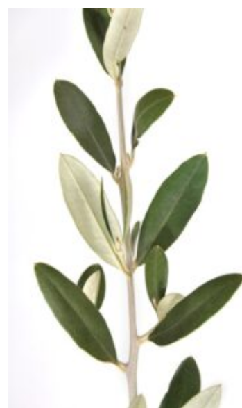
Rameau long (Mauguio)

Comment se voit le passage du rameau de l'année à celui de l'année suivante ? C'est par la taille des entre-nœuds qui sont plus courts, des feuilles plus petites et des bourgeons de teinte plus claire au printemps. Pendant cette saison, les feuilles ont une expansion rapide, atteignant leur taille maximale en deux semaines.