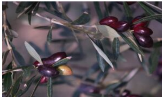
Olives lucques sur olivier Lucal

Un mystère entoure la production des fruits et les discussions n'en finissent pas sur les causes qui obèrent les récoltes, en excluant du présent propos l'évolution du fruit vers sa maturité. Le jeune fruit va grossir et subir les attaques plus ou moins fortes de parasites. Nous allons d'abord nous intéresser à la fleur et à la floraison.